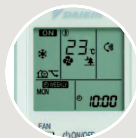
Infrarood-afstandsbediening (standaard) ARC452A1